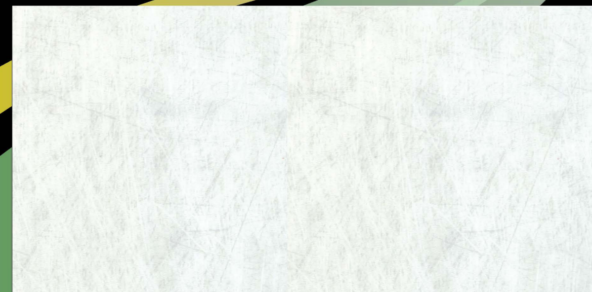
3509 | white

Ademais de Eternal Ótimo , Forbo Flooring oferece no Brasil outros produtos vinílicos como as coleções Eternal, Flex, Sarlon, Colorex (vinílico condutivo ESD), os pisos Coral para as áreas de recepção e os linóleos Marmoleum.