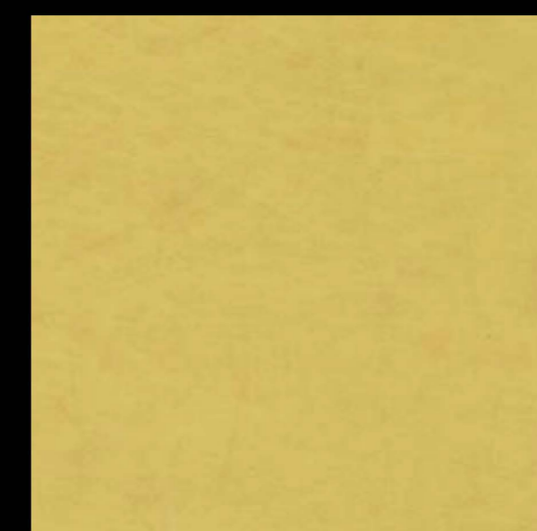
3507 | lemon