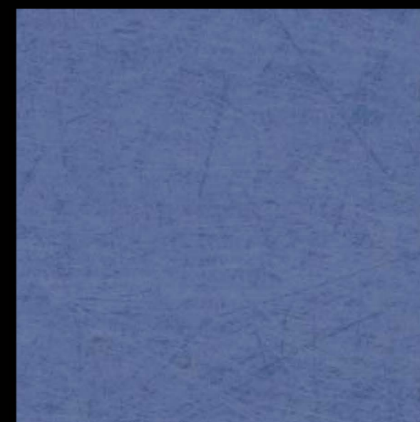
3506 | blue