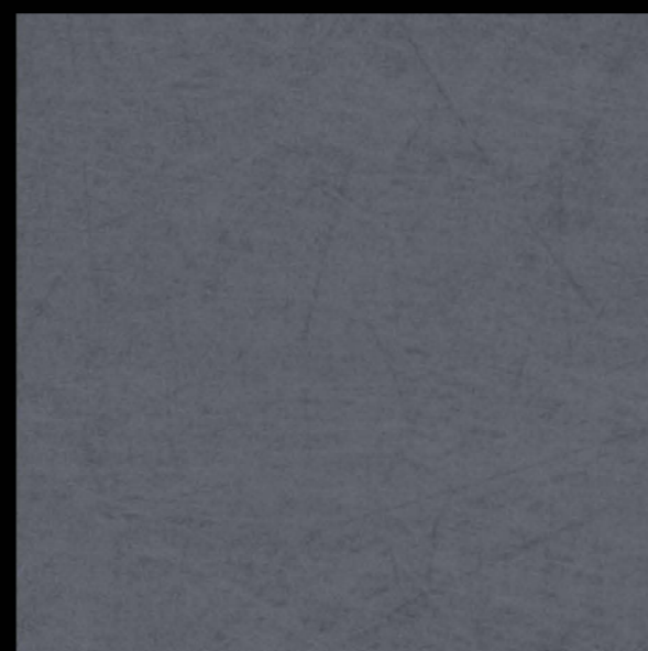
3504 | anthracite