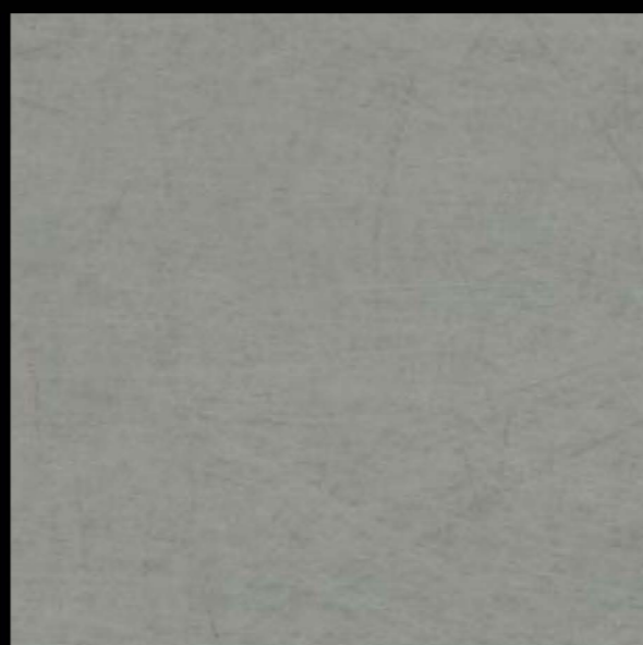
3502 | beige