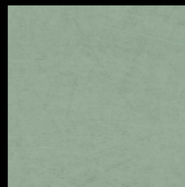
3505 | green