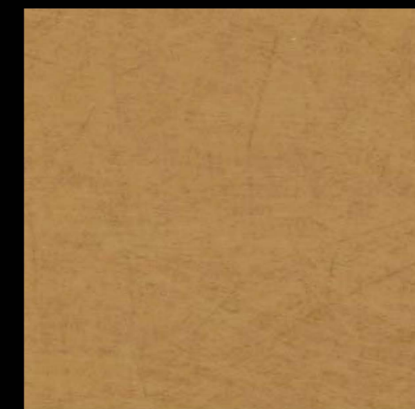
3508 | terracota