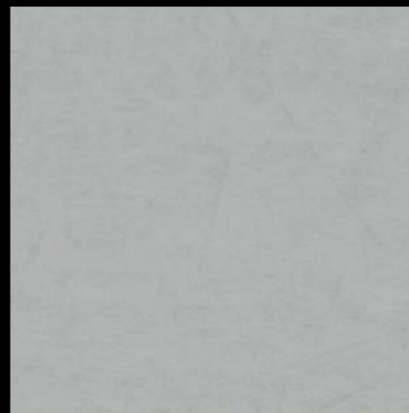
3503 | silver